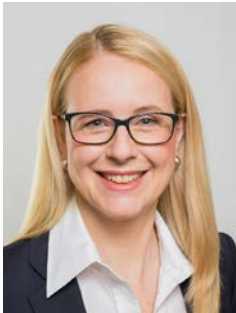
Dr. Margarete Schramböck Bundesministerin für Digitalisierung und Wirtschaftsstandort

Der österreichische Film hat in den letzten Jahren an internationalem Renommee gewonnen und sich zu einem bedeutenden Standortfaktor entwickelt. Durch die Filmstandortförderung FISA wird diese positive Entwicklung seitens meines Ressorts unterstützt. Einen immer wichtigeren Stellenwert in diesem Bereich besitzt der Wirtschaftsfilm.