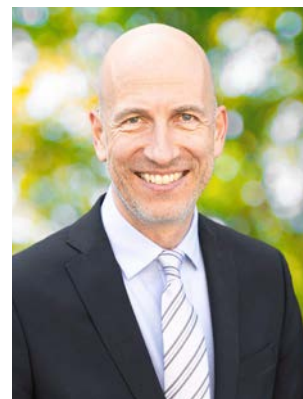
Bundesminister Univ.-Prof. Dr. Martin Kocher